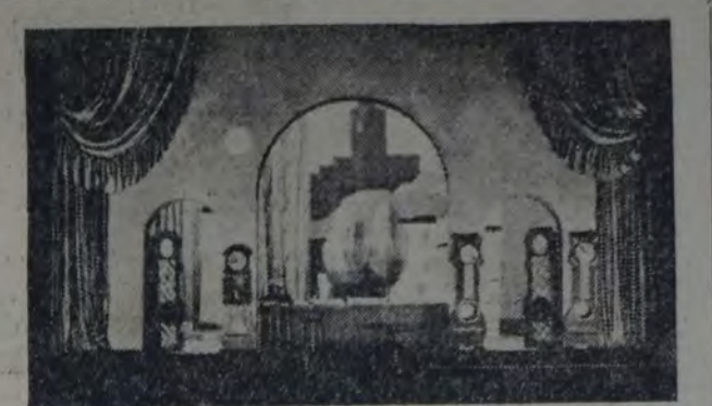
ESCENARIO DE "LA HORA ESPAÑOLA", DE RAVEL

Hacer escenografía, no es pintar más o menos el paisaje o estancia de una obra; es darle fuerza, emotividad, ayudar el asunto planteado y matizar con el mismo tono del libreto, la acción de los personajes. Para esto es necesario, "sentir" el escenario, colorar los tonos de acuerdo a la frase, disponer los juegos de luces y la utilería, al pensamiento emitido por el autor; color, línea y ambiente.