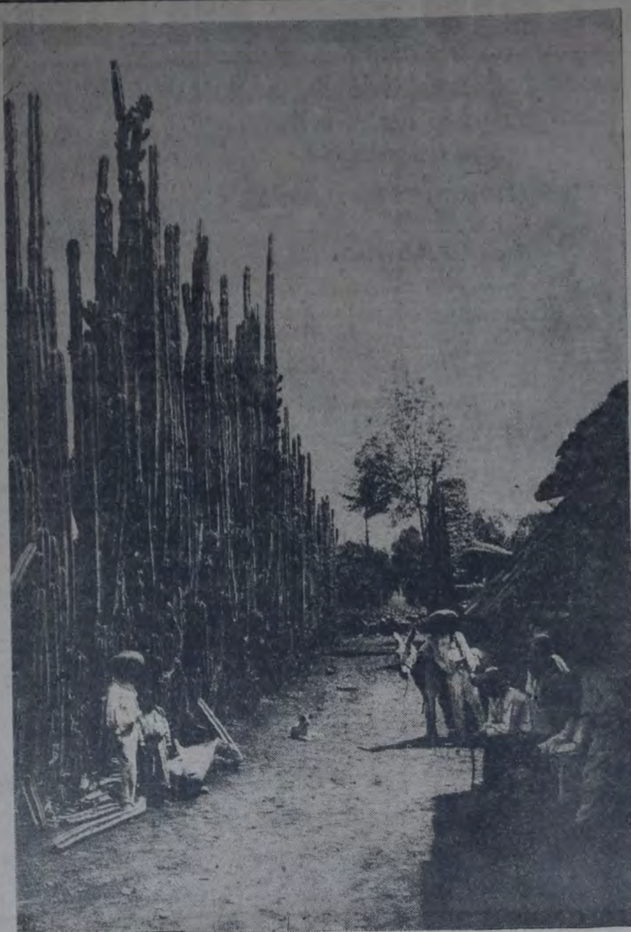
CALLE DE UNA ALDEA MEXICANA CON LOS CARACTERISTICOS CACTUS EN FORMA DE COLUMNAS

denen la esperanza de que antes del mes de agosto próximo podrán tomar una resolución definitiva respecto al tratado que declara la legalidad de la guerra, propuesto por el secretario de Estado de la Unión, Frank B. Kellogg.