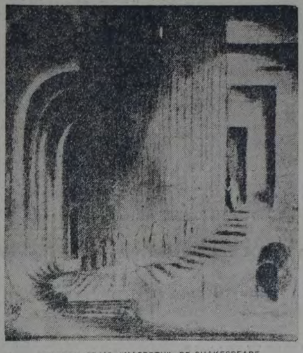
GORDON GRAIG, "MACBETH", DE SHAKESPEARE

Vemos pues, que el avance de la escenografía es grande. A veces es "todo" en una representación. Por ello este arte es magnífico, y el público, más exigente cada día, habla de él más a menudo y lo comprende aceptándolo como forma de expresión, tan grande como universal.