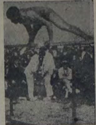
EL NUEVO CAMPEON FRANCES de gimnasia

cia comenzó con ejercicios libres; en la barra fija y en las paralelas no hubo ninguna sorpresa, y ninguno de los concurrentes mostró mayor entusiasmo. Los campeones pasaron entonces al "caballo"; ahí Larrouy obtuvo 14.50 puntos y 14.90, o sea un total de 29.40 puntos. En este ejercicio Solbach tuvo que contentarse con 13.90 y 13.60, o sea 28.50 puntos. Krauss estuvo satisfecho con 13.50 y 15 puntos, o sea 28.50 en total. Con una gran energía, presentando