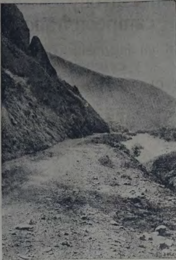
EL CAMINO DE ALEMANIA A CAFAYATE, EN SALTA