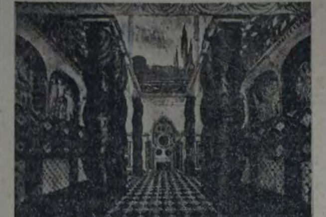
DECORACION DE LEON BAKST PARA "EL MARTIRIO DE SAN SEBASTIAN"

En los momentos actuales, la escenografía establece en forma acabada, su colaboración en la escena. Aquella que fué tomada siempre como una parte secundaria, (un par de telones para fondo de tal o cual obra). El decorador no hacía de su cometido, la presentación de un ambiente. Raras veces, autoridades en la materia, llevaron a escena "ambientes", que gozaban del beneplácito de un reducido "grupo" y que pasaban inadvertidos a los ojos del público en general. Tales fueron los escenarios de los "ballets" rusos, de Daghilleff, en el "Chauvre Souris", y algunos otros, primando siempre en privilegio de los eslavos: Soudekine, Bakst, etc.