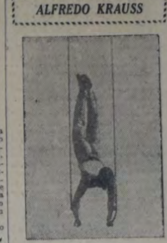
OTRO DE LOS COMPETIDORES del campeonato francés de gimnasia

barra fija (reglamentaria y libre), paralelas (idem. idem.), argollas (idem. idem.), caballo (id. id.), saltos (id. id.), respectivamente, la siguiente: 1. Larrouy, 27 p. 95; 28 p. 40; 29 p. 20, y 29 p. 50; 29 p. 35 y 29 p. 30; 29 p. 55, 27 p. 32, 14 p. 50 y 14 p. 90. Total, 239 p. 92. 2. Solbach, 29 p. 30, y 28 p. 30; 29 p. 90 y 27 p. 70; 29 p. 30, y 29 p. 40; 28 p. 70 y 29 p. 45; 28 p. 78, 17 p. 90, y 13 p. 60. Total, 287 p. 34. 3. Krauss: 27 p. 85 y 27 p. 80; 29 p. 8 y 29 p. 30; 28 p. 80, y 29 p. 95; 29 p. 70, y 27 p. 27 p. 99, 13 p. 50 y 15. Total, 236 p. 49. 4. Gounot: 28 p. 80 y 29 p. 45; 27 p. 20, y 28 p. 86; 29 p. 65, y 29 p. 40; 27 p. 70, y 29 p. 20; 29 p. 32, 10 p. 50, y 14 puntos. Total, 235 p. 97. De "Le Miroir des Sports".